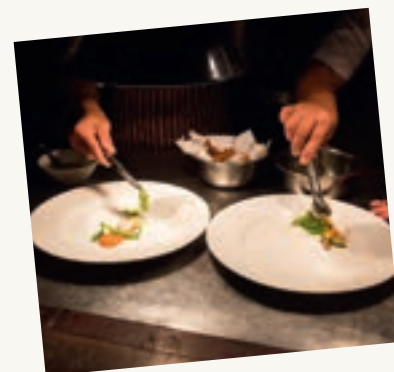
DE LAOTIAANSE CHEF LEERT DE FIJNE KNEEPJES VAN ZIJN FRANSE COLLEGACHEF