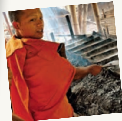
MONNIKENWERK: HET DROOGKOKEN VAN ZOUT