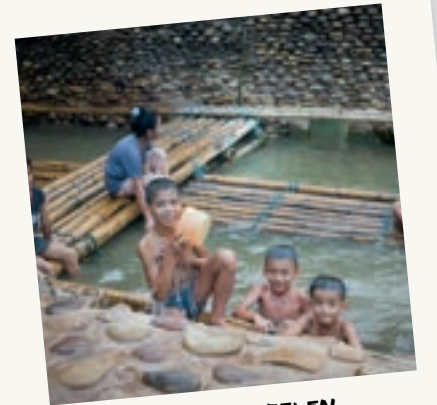
KINDEREN SPELEN EN BADEN IN DE NATUURLIJKE HOTSPRING

massage worden gecombineerd met technieken die ik nog niet eerder heb ervaren.