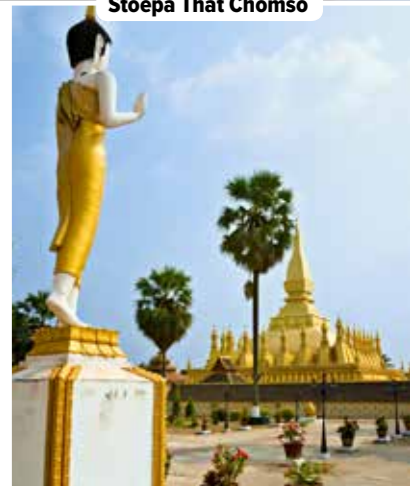
Stoepa That Chomso

DOOR WILKE MARTENS