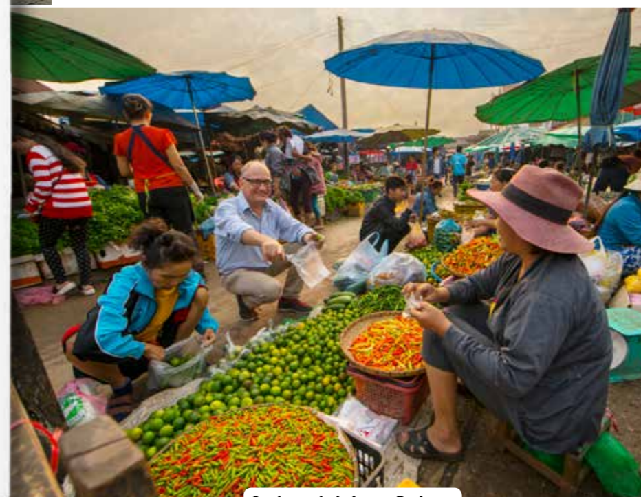
Op de markt in Luang Prabang

• Een goede kop koffie met lekernij haal je bij Joma Bakery, aan de Kingkitsarath Road. De huisgemaakte taart gaat goed bij de koffie van Laotiaanse bonen. Joma is populair bij zowel toeristen als Laotianen. www.joma.biz/luang-prabang-laos