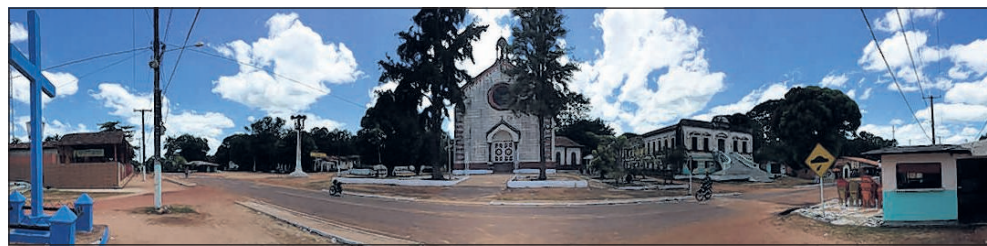
■ De voormalige leprakolonie.

les weet over het dorp. Nee, ik moet niet denken dat lepra verdwenen is. Er worden nog altijd zieken behandeld in het lokale ziekenhuisje en de meeste mensen die hier wonen, hebben ooit lepra gehad. De een wat erger dan de ander. Gelukkig is het niet besmettelijk, dus we hoeven ons geen zorgen te maken. Dit vertelt de man terwijl hij zijn hoestbui smoort in de hand die ik zojuist hartelijk heb geschud. Als we belangstellend rondkijken in het hospitaaltje begin ik het toch een beetje benauwd te krijgen. Het ziet er niet fijn