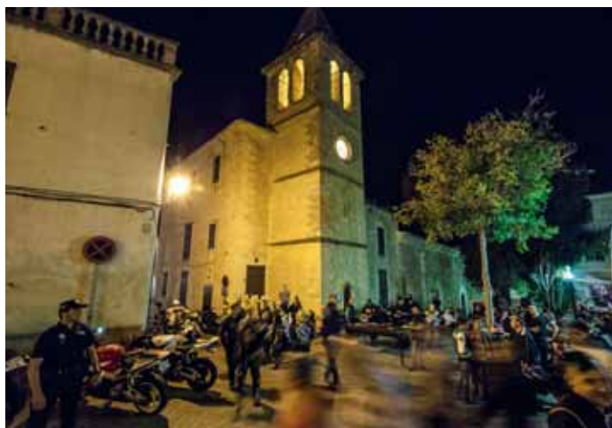
Op het keerpunt in Son Servera wordt eten geserveerd aan de deelnemers.