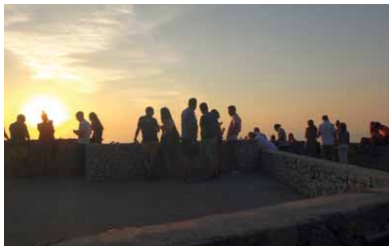
Een zonsondergang voor romantische zielen.