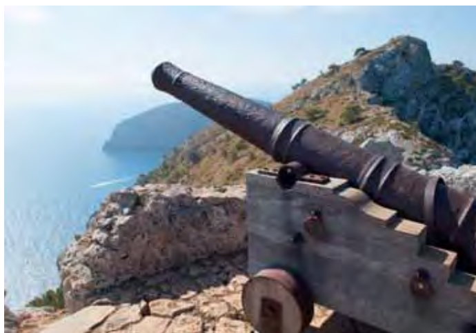
In vroeger tijden werden toeristen nog verjaagd.