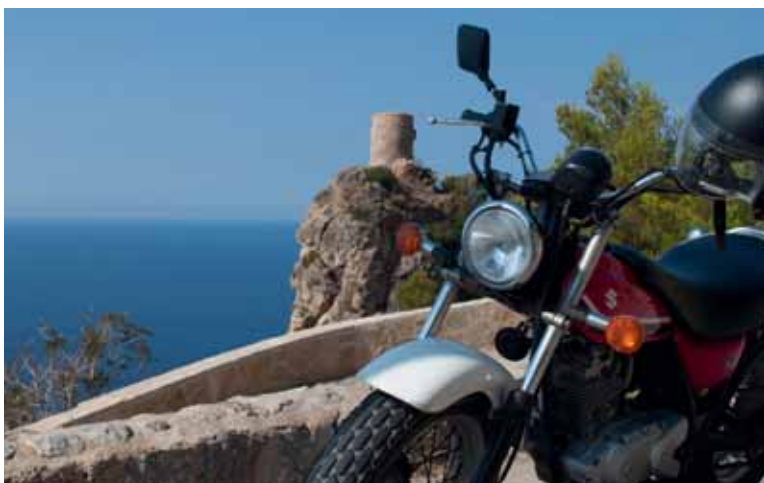
De Torre del Verger staat op menige foto.

Pas als ik het 'centrum' uit ben, valt het me op dat tegen de helling terrassen zijn aangelegd, helemaal van zeeniveau tot aan de top van de berg. Van de elfde tot de veertiende