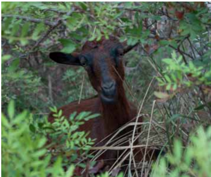
Oppassen: overstekende geit!