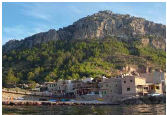
In het noordwesten van Mallorca zijn de strandjes leeg.