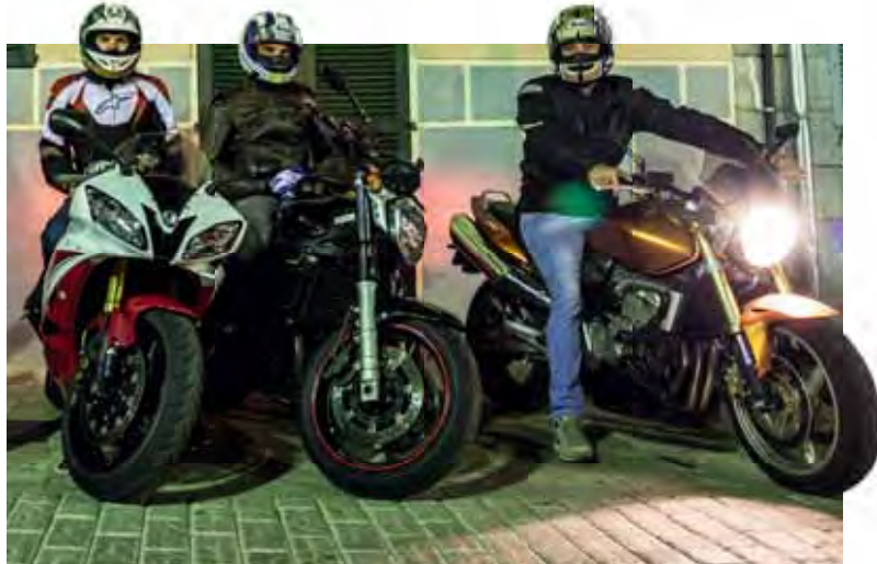
Tijdens de Volta is lawaai geoorloofd.