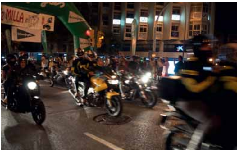
In file rijden de deelnemers aan de Volta Palma uit.