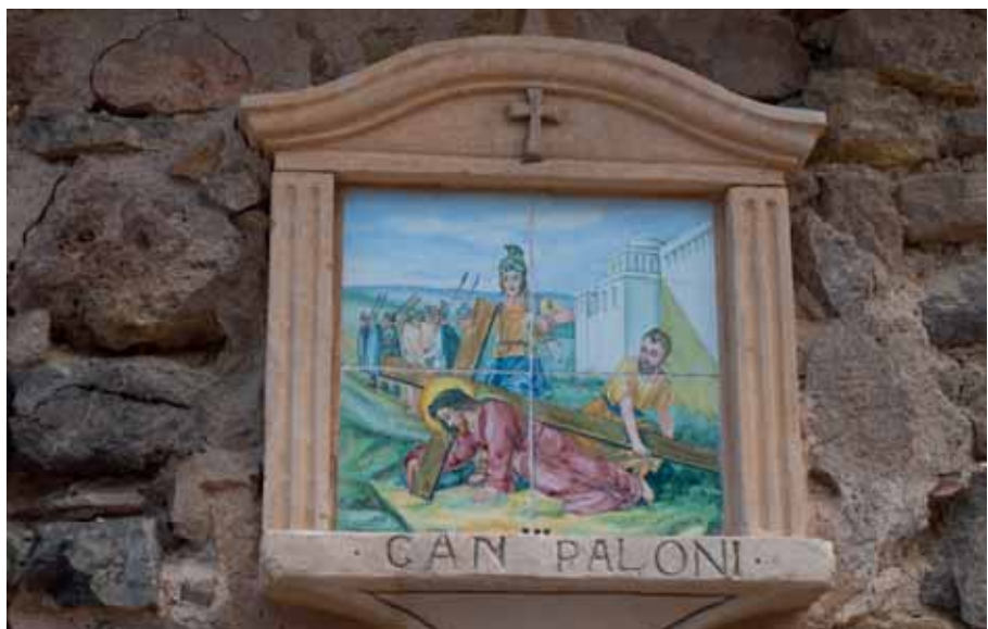
De straatnaamborden in Deïá verbeelden ook de lijdensweg van Jezus.